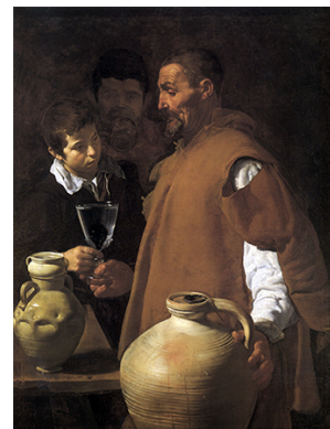
El aguador de Sevilla